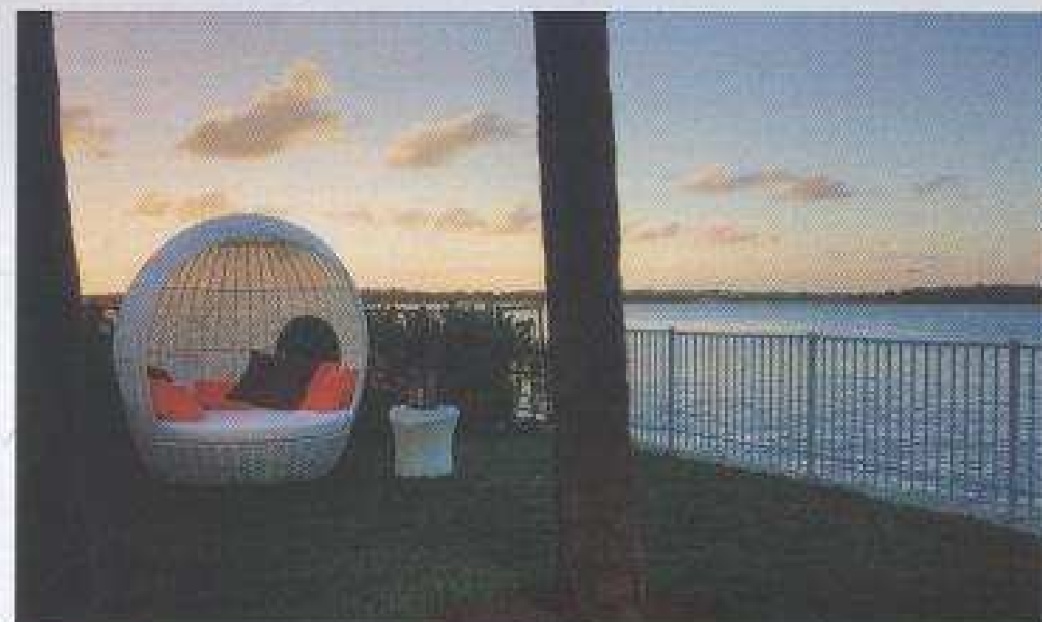
QUARZO. El hotel boutique con habitaciones para diversos bolsillos.

vacidad y un trato personalizado y ágil. No por nada es conocido como el Centro Comercial más productivo en el mundo, con ventas anuales por más de 9 mil 184 dólares por metro cuadrado.