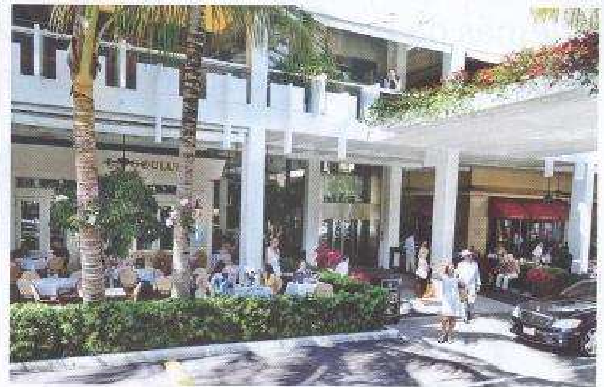
BAL HARBOUR SHOPS. Es conocido como el mall más productivo del mundo, con ventas anuales de 9 mil dólares por metro cuadrado.