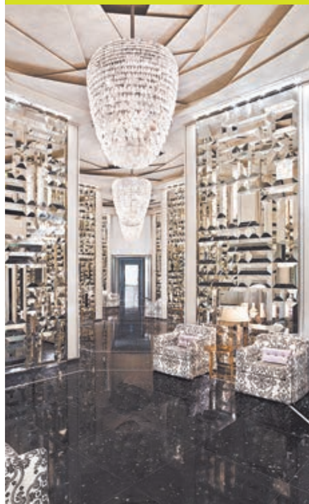
LA AMPLITUD y elegancia de las suites del ONE Bal Harbour Resort compiten en belleza con las vistas de la bahía.