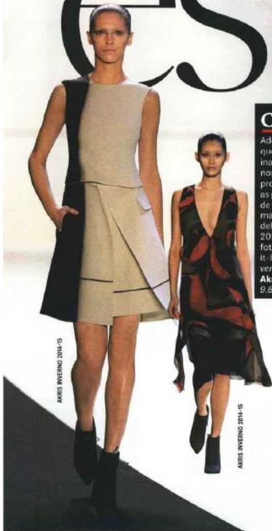
AKRIS INVERNO 2014-15